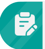
График Государственной итоговой аттестации